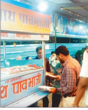
खाद्य पदार्थों की जांच करने पहुंचे अफसर।