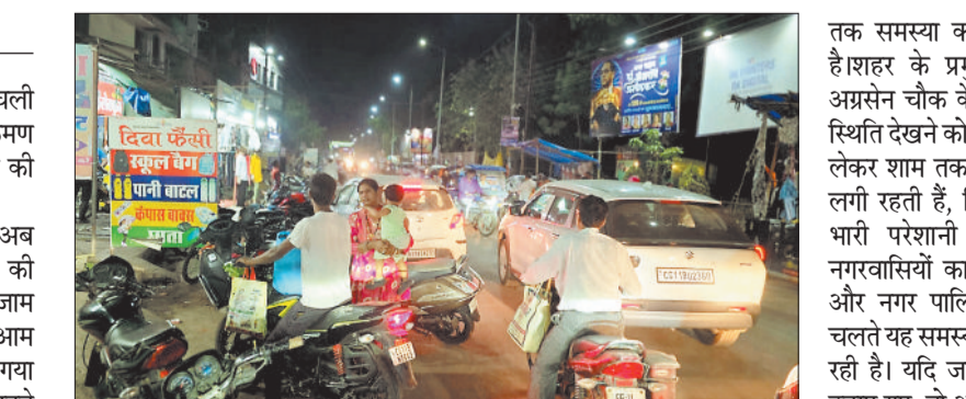
सड़क के बीच बनी जाम की स्थिति।

सक्ती में ट्रैफिक व्यवस्था ध्वस्त हो चली है। जिसकी वजह से शहर में अतिक्रमण और अव्यवस्था से रोज जाम लगने की स्थिति बन रही है। नगर में बढ़ती ट्रैफिक समस्या ने अब विकराल रूप ले लिया है। शहर की लगभग हर मुख्य सड़क पर दिनभर जाम की स्थिति बनी रहती है, जिससे आम नागरिकों का आना-जाना दूधर हो गया है। लोग रोजाना घंटों जाम में फंसे रहने को मजबूर हैं और कई बार मामूली बातों पर विवाद की स्थिति भी बन जाती है। ट्रैफिक इंस्पेक्टर वाय.एन. शर्मा ने इस समस्या के लिए सड़कों पर हो रहे अतिक्रमण को मुख्य कारण बताया है। उनका कहना है कि सड़क किनारे