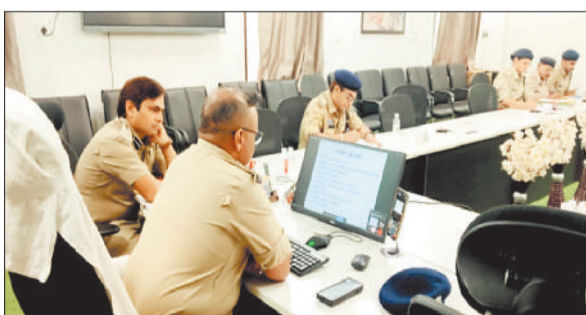
वर्चुअल प्रशिक्षण में जानकारी देते आईजी व पुलिस अधिकारी।