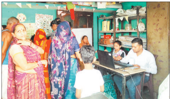
आंगनबाड़ी केन्द्र में ई केवायसी कराने पहुंची महिलाएं।

मिलने में परेशानी हो सकती है। प्रशासन और आंगनबाड़ी कार्यकर्ताओं द्वारा महिलाओं से अपील की गई है कि वे समय पर अपने नजदीकी आंगनबाड़ी केंद्र पहुंचकर आवश्यक दस्तावेजों के साथ ई-केवाइसी की प्रक्रिया पूरी कराएं, ताकि भविष्य में योजना का लाभ निर्बाध रूप से मिलता रहे।