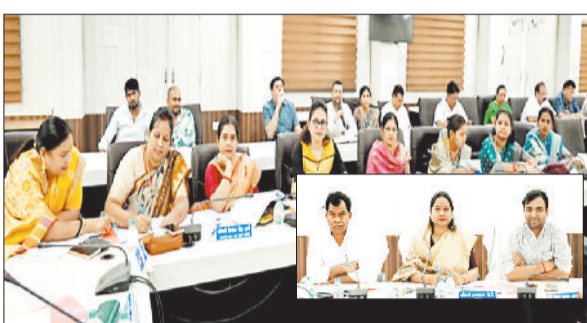
सामान्य सभा की बैठक में जिला पंचायत सदस्य।

जिला पंचायत अध्यक्ष की अध्यक्षता में सामान्य सभा की बैठक आयोजित की गई। इस दौरान उद्योगों को जलकर बकाया राशि वसूली को लेकर नोटिस देने के निर्देश दिए। साथ ही साथ पेयजल व्यवस्था को लेकर भी निर्णय लिया गया।