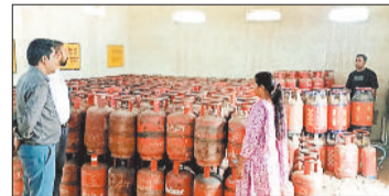
बनाया गया। जांच समय उपस्थित नगरदा इंडेन ग्रामीण वितरक गैस एजेंसी के संचालक द्वारा अपने कथन में बताया गया कि उक्त गैस एजेंसी का इंडियन ऑइल कॉर्पोरेशन लि. के

सक्ती जिले के नगरदा गैस एजेंसी में खाद्य निरीक्षक सक्ती, खाद्यनिरीक्षक मालखरौदा, एवं खाद्य निरीक्षक जैजैपुर के संयुक्त जांच दल द्वारा ग्राम नगरदा स्थित नगरदाइंडेन ग्रामीण वितरक गैस एजेंसी की जांच की गयी। जांच समय नगरदा इंडेन ग्रामीण वितरक गैस एजेंसी के संचालक की उपस्थिति में जांच हुए जिनका मौके पर कथन दर्ज कर पंचनामा